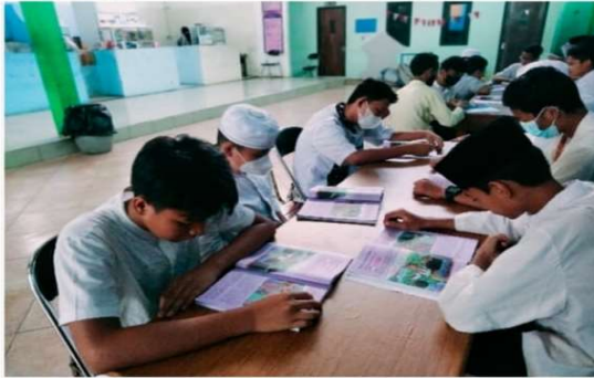
Pengembangan Literasi Tahap Pembiasaan

Pada dasarnya literasi numerasi bukan hanya sebatas membaca karena literasi adalah suatu kegiatan menangkap, melihat, menganalisa atau menginterpretasi informasi. Kesadaran akan pentingnya kompetensi literasi dan numerasi pada siswa, mendorong SMPN 20 Jakarta untuk mengembangkan program literasi numerasi yang sudah berjalan sebelumnya. Masa pandemi Covid-19 juga telah memberikan tantangan bagi pelayanan pembelajaran di SMPN 20 Jakarta, dan dijawab lugas dengan penyelenggaraan sistem Pembelajaran Jarak Jauh (PJJ). Ternyata PJJ justru telah membuat kegiatan literasi numerasi berjalan dengan lebih mengasikkan dan menyenangkan bagi siswa.