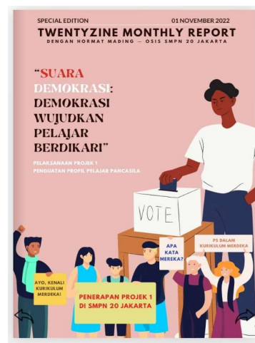
TewntyZine SMPN 20 Jakarta

Demikian praktik baik implementasi literasi numerasi di SMPN 20 Jakarta, semoga dapat menginspirasi bagi yang membaca. Saran dan masukan sebagai upaya pengembangan program, sangat dinantikan. Salam Literasi!